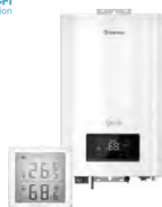
Электрические котлы и комнатные термостаты