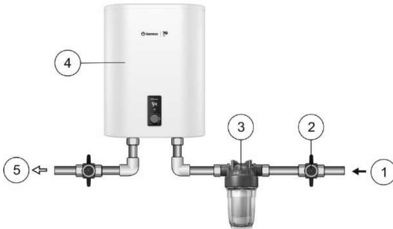
Рис.2 Схема подключения фильтра.

Внимание! Если водопровод не будет использоваться более двух суток, необходимо перекрыть общий кран подачи холодной воды на дом/квартиру.