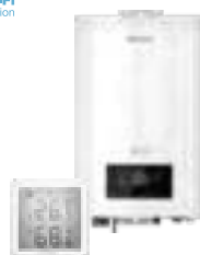
Электрические котлы и комнатные термостаты