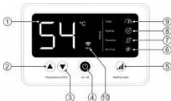
Рисунок 2. Электронная панель управления