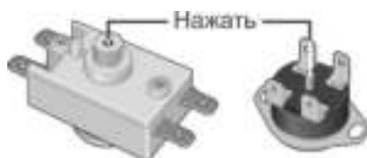
Рисунок 2. Схема расположения кнопки термовыключателя

Вышеперечисленные неисправности не являются дефектами ЭВН и устраняются потребителем самостоятельно или за его счет.