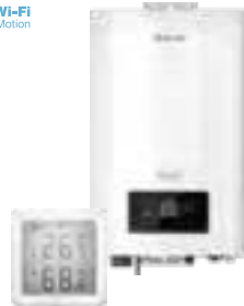
Электрические котлы и комнатные термостаты